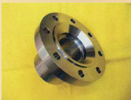
【280φ × 100φ × 182L】