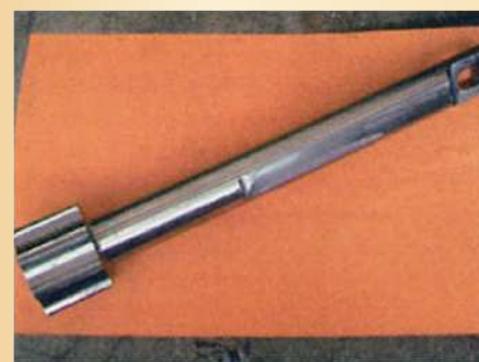
【270φ × 200H × 150φ × 1600L】

◎ 製作可能サイズ：丸材φ1200まで、角材□600まで、長さ8mまで。 (クレーンで吊り上げての大型機械加工が可能です。)