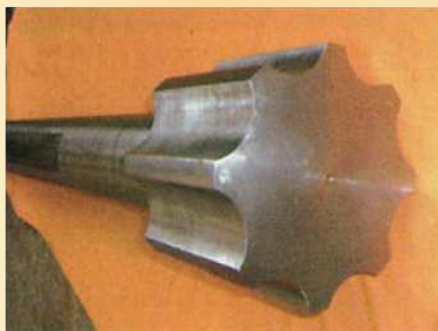
【270φ × 200H × 150φ × 1600L】