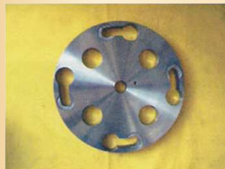
【350φ × 40φ × 40t】