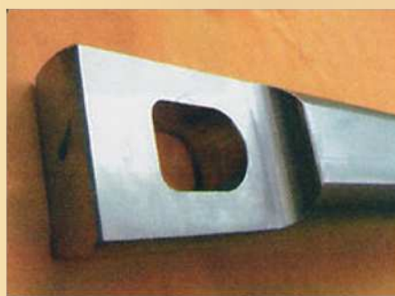
【270φ × 200H × 150φ × 1600L】