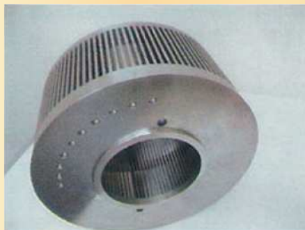
【ローター 280φ × 150L】